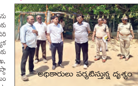
అధికారులు పర్యటిస్తున్న దృశ్యం