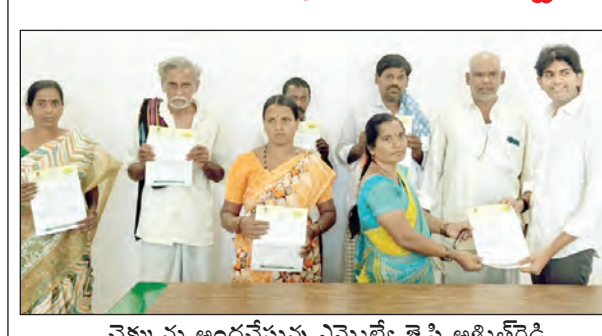
చెక్కులు అందచేస్తున్న ఎమ్మెల్యే జె.సి అశ్విత రెడ్డి

తాడిపత్రి నియోజకవర్గం వ్యాప్తంగా పలువురికి మంజూరైన సిఎం రిలీఫ్ ఫండ్ చెక్కులను తాడిపత్రి పట్టణంలోని ఎమ్మెల్యే కార్యాలయంలో ఎమ్మెల్యే జె.సి అశ్విత రెడ్డి బుధవారం పంపిణీ చేశారు. ఇందులో భాగంగా 35 మందికి కూలమి ప్రభుత్వం మంజూరు చేసిన 18,94,242 రూపాయల సీఎం రిలీఫ్ ఫండ్ చెక్కులను ఎమ్మెల్యే వారికి అందచేశారు. సిఎంఆర్ఎఫ్ నిధి ద్వారా చెక్కులు అందడంతో లబ్ధిదారులు సంతోషం వ్యక్తం చేశారు. ఇప్పటి వరకు తాడిపత్రి నియోజకవర్గానికి చెందిన 526 మందికిగాను ముఖ్యమంత్రి సహాయనిధి ద్వారా మంజూరైన 3,94,43,766 రూపాయల చెక్కులను ఎమ్మెల్యే జె.సి అశ్విత రెడ్డి పంపిణీ చేశారు.